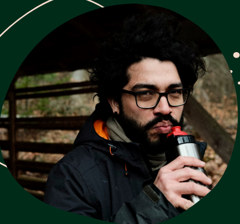
Carlos Herrera GRAFIK & GESTALTUNG